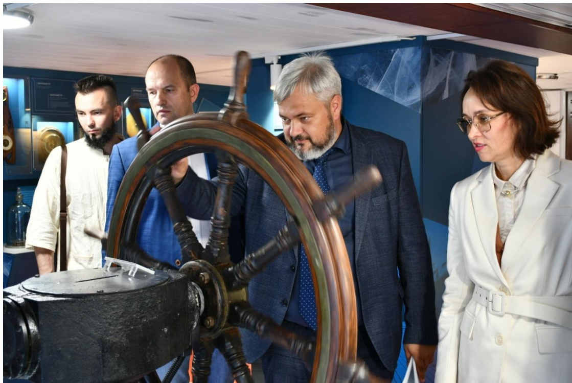
Открытие новой постоянной экспозиции на ледоколе «Ангара»

Успешно шла реализация просветительского патриотического проекта «На всю оставшуюся жизнь» . В проекте принимают участие все 7 отделов музея, а также 30 муниципальных музеев, выставочные площадки муниципальных образований Иркутской области. Проект включает в себя музейные мероприятия, посвященные Дням воинской славы России, государственным праздникам, памятным датам и событиям истории Отечества, мемориальные,