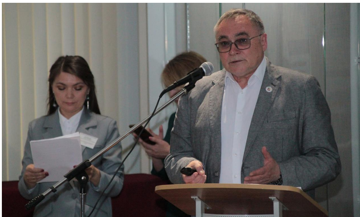
Открытие XXII фестиваля музеев Иркутской области «Маёвка – 2024»