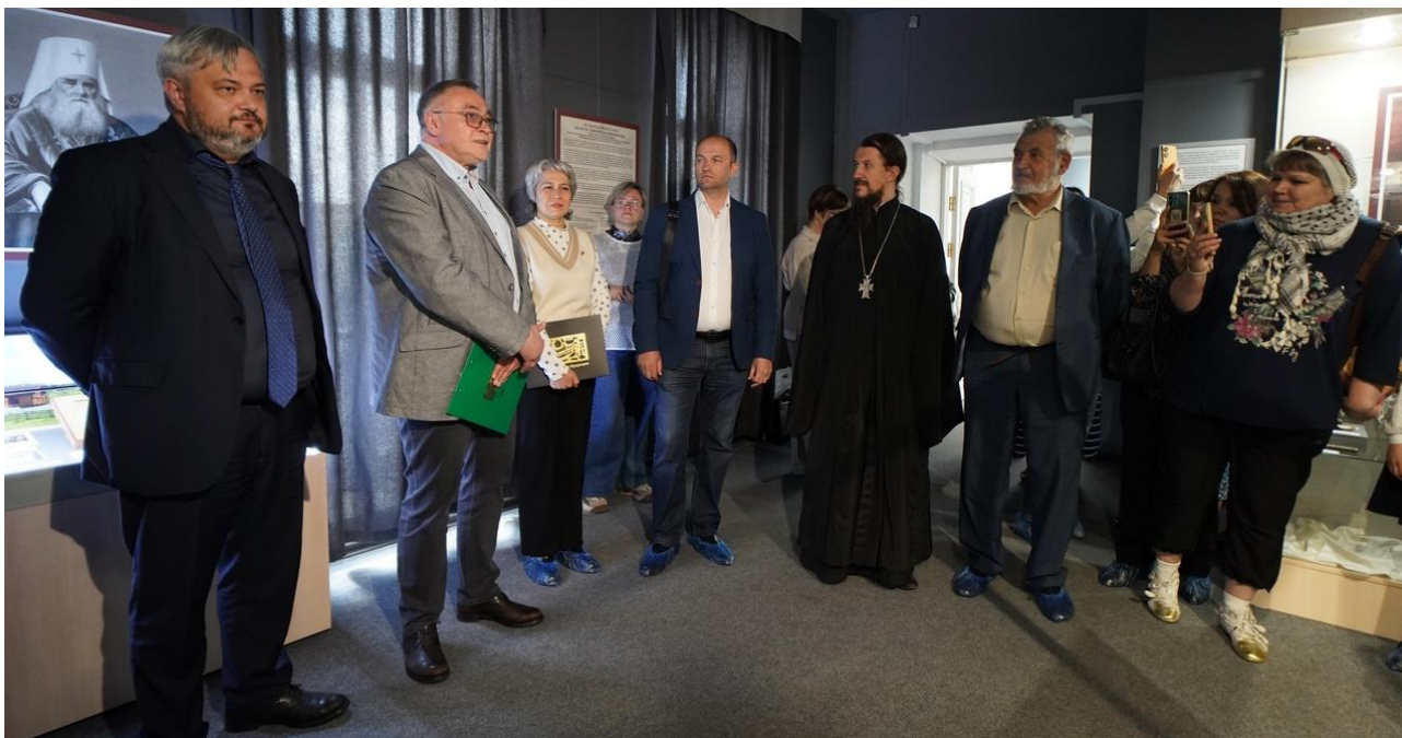
Открытие выставки «От Анги до Форта Росс: по пути святителя Иннокентия»

уникальный экспонат – шкатулка, сделанная руками святителя Иннокентия (Вениаминова).