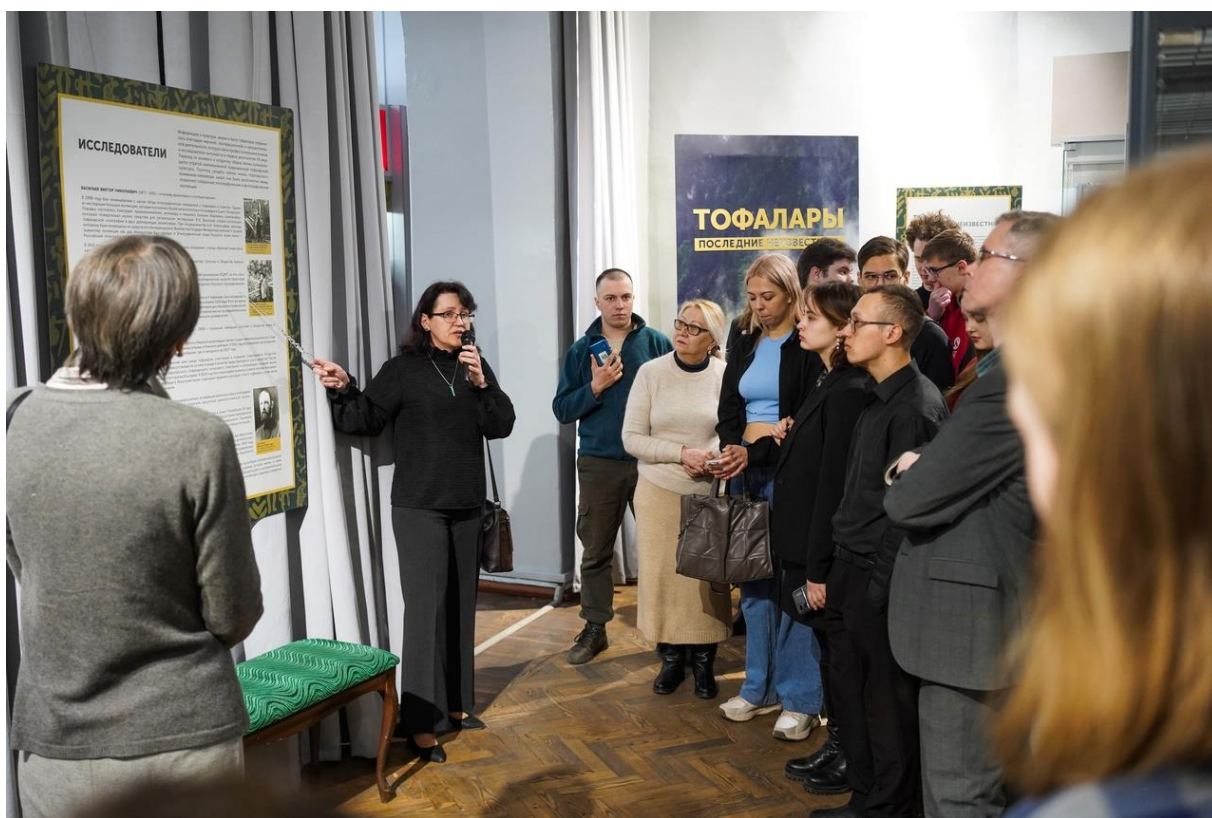
Открытие выставки «Тофалары. Последние неизвестные»

В 2024 году музеем были реализованы несколько межмузейных выставочных проектов. В марте была открыта выставка «Тофалары. Последние неизвестные» . Это совместный выставочный проект Иркутского областного краеведческого музея им. Н.Н. Муравьева-Амурского, Новосибирского государственного краеведческого музея и Российского этнографического музея. Выставка объединила на одной площадке предметы из этнографических коллекций трех российских музеев, обладающих наиболее полным собранием предметов, характеризующих быт тофаларов — это одежда, детские игрушки, предметы быта, орудия для охоты, фотографии.