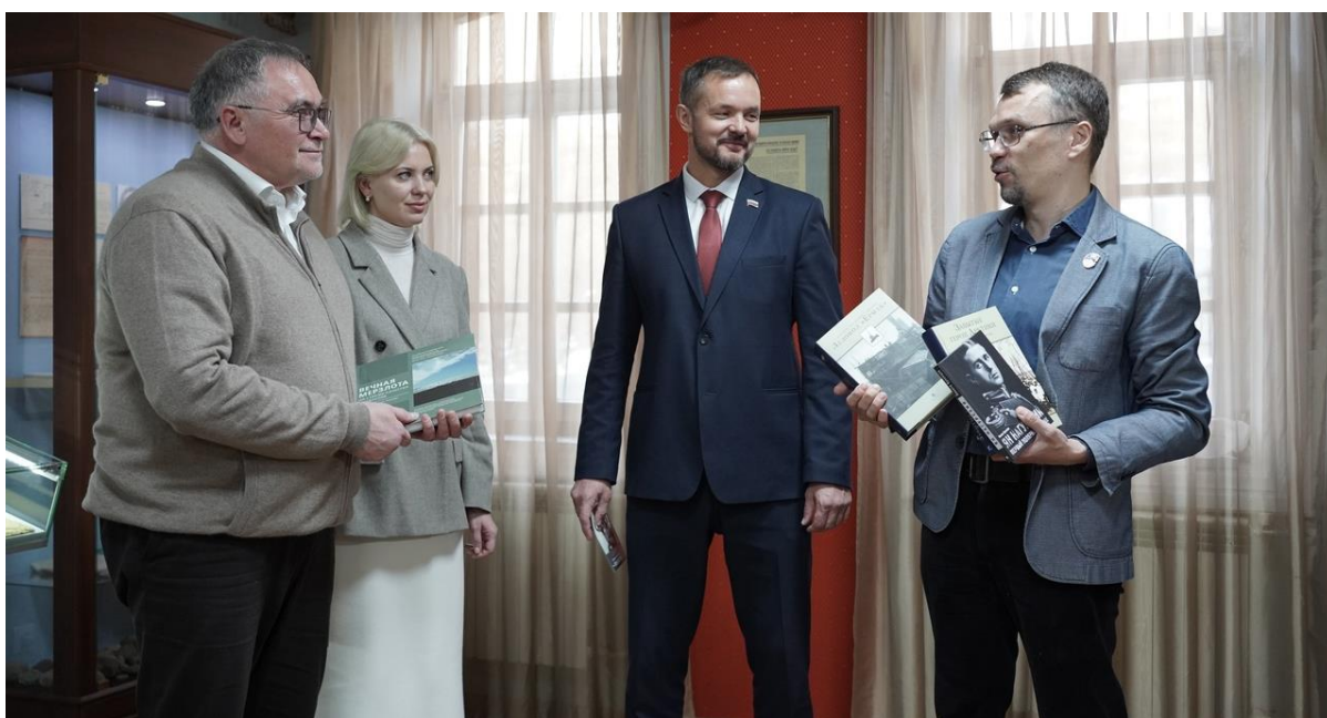
Открытие выставки «А.В. Колчак – известный и неизвестный»

К 150-летию со дня рождения А.В. Колчака была открыта выставка «А.В. Колчак – известный и неизвестный» . В выставочном проекте, кроме Иркутского областного краеведческого музея, приняли участие Дом русского зарубежья имени Александра Солженицына (г. Москва), Государственный архив Российской Федерации, Российский государственный архив Военно-морского флота, Иркутский государственный университет, Государственный архив Иркутской области, частные коллекционеры.