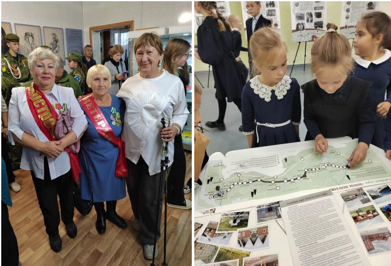
Мероприятия в рамках проекта «Музейный экспресс»