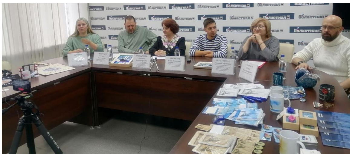
Презентация сувенирной продукции для ледокола «Ангара»

Продажа представленной в музейном магазине сувенирной продукции (На данный момент в продаже представлено 1529 наименований и более 20 видов различной сувенирной продукции на сумму 230 875 рублей). Доходы от реализации сувенирной и полиграфической продукции во всех отделах музея составили: 1 998 444, 00 руб. (в 2023 году - 1 502 128, 00 руб.).