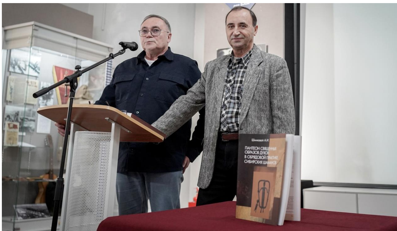
Презентация каталога шаманской коллекции музея «Пантеон священных образов духов в обрядовой практике сибирских шаманов»